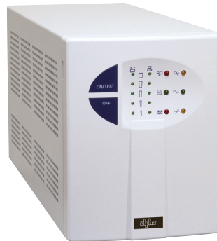
Standgerät 600 zu 3000VA

600 bis 3000VA Unterbrechungsfreie Stromversorgung