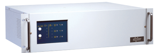
19" Rackmount 800 zu 2000VA